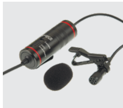
Voice E2 Jack