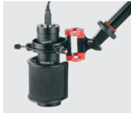
StudioVoice C34 HPF XLR