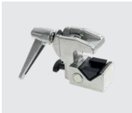
Зажим MegaClamp MC-050