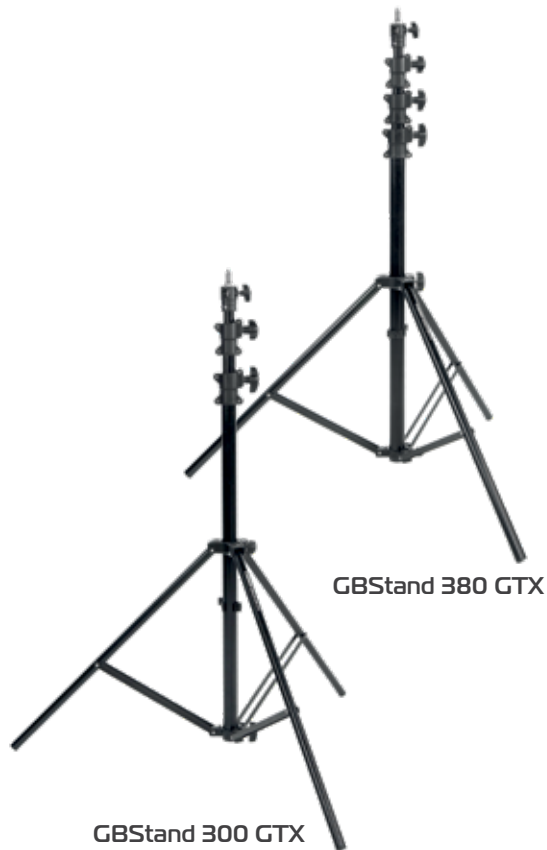
GBStand 380 GTX