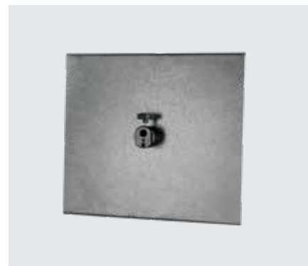
Крепление для ноутбука NM-19