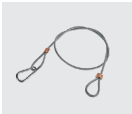
Шнур страховочный для осветителей SH-308 – 80см, SH-510 – 100 см