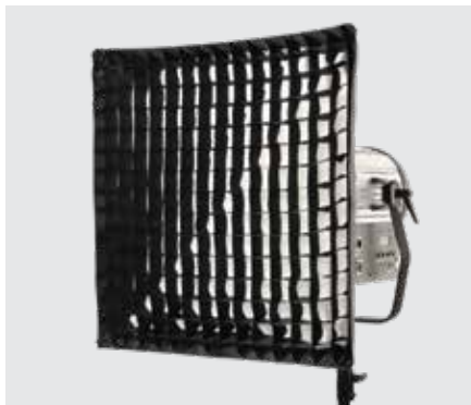
Софтбоксы SoftFresnel HC