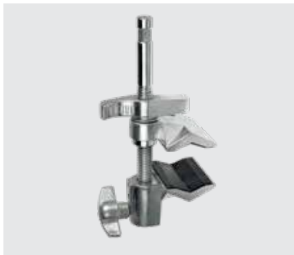
Зажим MegaClamp MC-078A