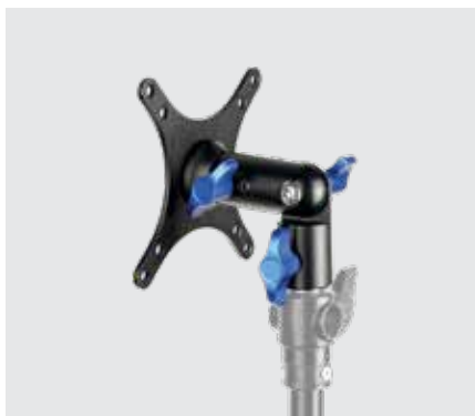
Крепление для монитора MM-1016T наклонное