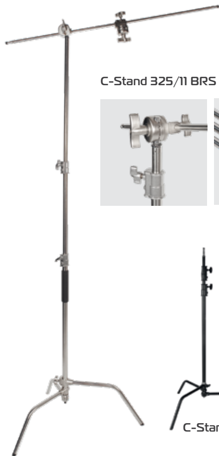
C-Stand 325/11 BRS