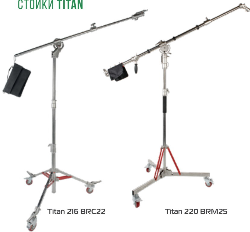
Titan 216 BRC22