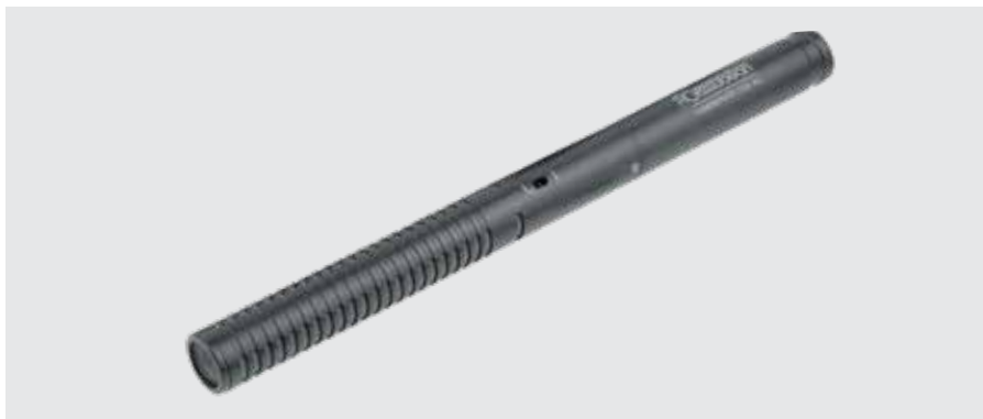
CameraVoice C600 XLR