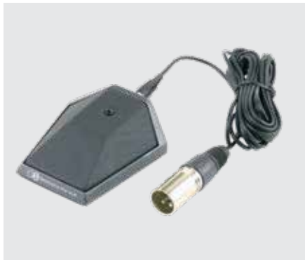
Voice 4 flesh S-Jack