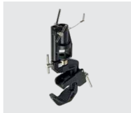
Зажим-струбцина MegaClamp MC-080